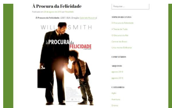
Figura 1 – Modelo de exibição do filme no site.

As figuras a seguir ilustram o resultado da página elaborada contendo às análises: