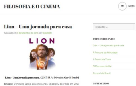
Figura 1 - Interface do Blog Filosofia e Cinema.

Assisti, até o momento, 9 filmes e elaborei 9 relatórios. Os relatórios são elaborados da seguinte maneira: a seção “Sinopse”, onde é abordado um pequeno resumo do contexto do filme, sem divulgar muito da história; a seção “Para prestar atenção”, que mostra aos alunos cenas ou diálogos que abordam algum dos conteúdos lecionados em sala de aula; e “Exercício”, que fomenta o aluno a relacionar os conteúdos abordados em sala de aula com o assistido nos filmes. Abaixo está a Figura 1 que mostra o site disponibilizado para os alunos como material de apoio, onde consta todos os filmes para que uma escolha qual será abordado em sua atividade.