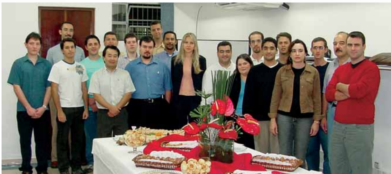
Primeiros alunos de mestrado de Engenharia Elétrica da FEI, em 2005

de participação em congressos e com professores reconhecidos pela academia. Na área de Robótica e Inteligência Artificial, o grupo da FEI também é forte e se tornou referência no País. O coordenador orgulha-se de a FEI ter conseguido boa visibilidade nacionalmente e estar ganhando espaço internacional. “No Brasil, não se fala em robótica sem citar o grupo da FEI. Na área de processamento de sinais também já há pesquisas do nosso grupo de grande visibilidade acadêmica e tecnológica”, descreve.